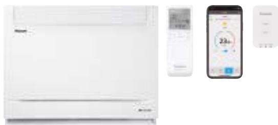
CZ-TACG1 Panasonic WLAN-modul til internetstyring.