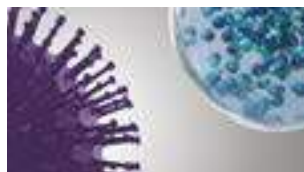
nanoe™ X når effektivt forurenende stoffer.

Takket være nanoe™ X's egenskaber kan en række forurenende stoffer såsom bakterier, virusser, mug, allergener, pollen og visse farlige stoffer deaktiveres.