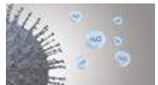
Forurenende stoffers aktivitet hæmmes.