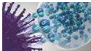
Hydroxylradikaler denaturerer proteinerne i forurenende stoffer.